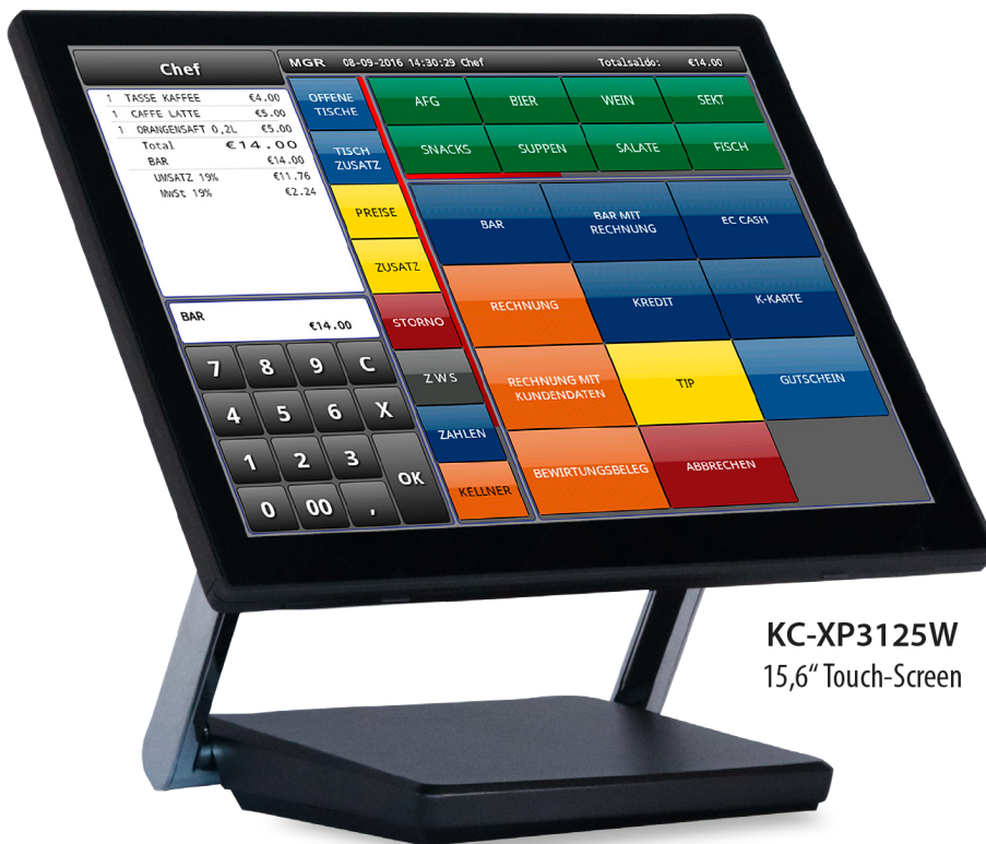
KC-XP3125W 15,6" Touch-Screen

Kasse mit 15,6 Zoll Breitbild Touch-Screen