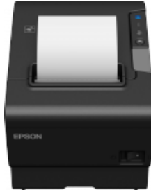
Abbildung 2 Epson TM-T88 Thermo