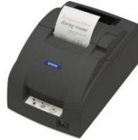
Abbildung 3 Epson TM-U220B Nadel