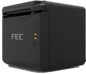
Abbildung 1 FEC TP-100! Thermo