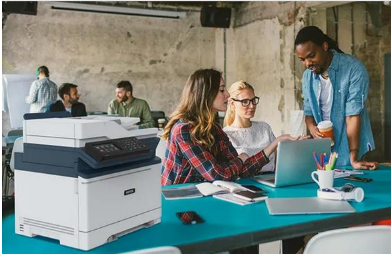
Abbildung Xerox C315 Farbmultifunktionsdrucker

Für den Druck der täglich neuen Speisekarte